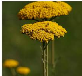
Angelika Wolter / pixelio.de